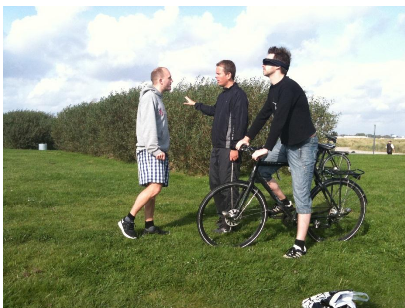
Hvor skal vi hen..?

To medlemmer af bestyrelsen for 2012 diskuterer strategi mens en trofast følgesvend spændt venter på instrukser..