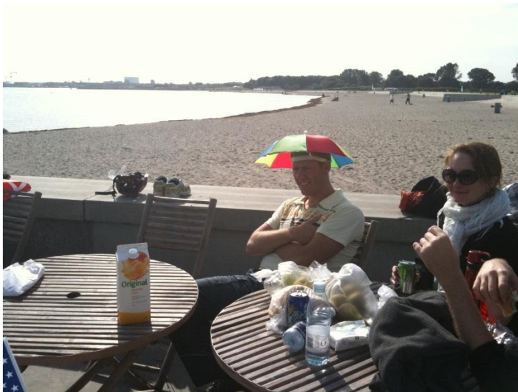
Der skal også være tid til afslapning. Og man kan jo godt gå hen og blive lidt lysfølsom på sine gamle dage ...