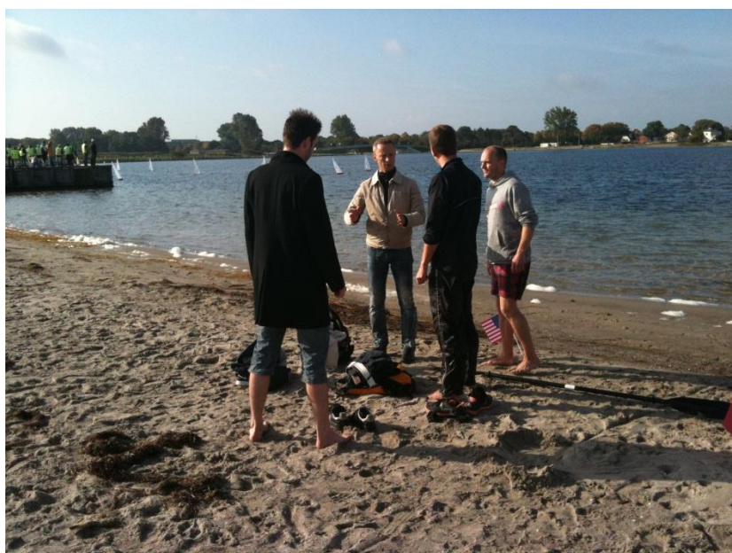
Instruktion i gruppe-længdespring