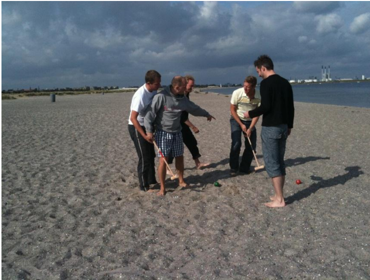
En sand leder ...