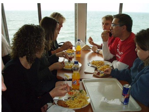
Den obligatoriske wienerschnitzel på færgen...

NB: Redaktionen kan meddele, at bestyrelsen har besluttet at støtte dette arrangement med 250 DKK pr. deltager – så er der lidt ekstra at købe nisser for... ☺