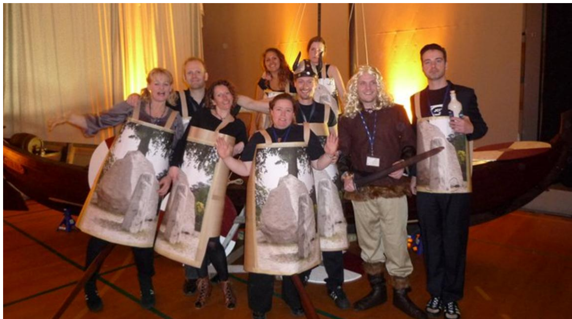
Bemærk "Stoneface" til højre. Meget apropos...

Jeg håber vi ses på en kongres derude, for jeg skal af sted igen.